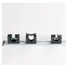
Gerätehalter Gerätehalter 20 - 30 mm Art. Nr. 101048 Gerätehalter 30 - 40 mm Art. Nr. 101049 Schiene 500 mm Art. Nr. 101050 Schiene 900 mm Art. Nr. 101051