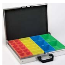
Aluminiumkoffer mit Insetboxen Abb. 1 Art. Nr. 100921 Abb. 2 Art. Nr. 100922 Abb. 3 Art. Nr. 100923