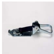
Spannverschluss aus verzinktem Stahl Länge Gummiband 90 mm Art. Nr. 100893