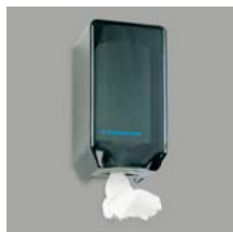
Handtuchhalter mit Papier-Einwegtüchern Art. Nr. 100938 9 Ersatzrollen Art. Nr. 100939