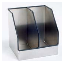
Ablagebox Aluminium, mit 2 Fächern Art. Nr. 100895