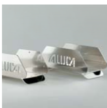
Schlauchhalter aus Aluminium Schlauchhalter SH25 Breite 250 mm Art. Nr. 105614 Schlauchhalter SH32 Breite 320 mm Art. Nr. 105616