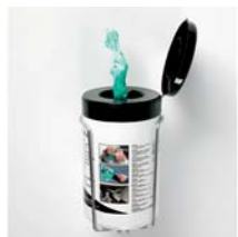
Feuchte Reinigungstücher Inhalt 50 Tücher Art. Nr. 100943 Wandhalterung Art. Nr. 100945