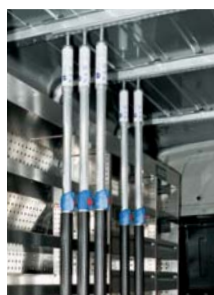
Teleskop-Sperrstange Aluminium Länge 1250-1750 mm Art. Nr. 103512 Länge 1550-2050 mm Art. Nr. 103153