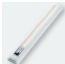
LED-Leuchte 24 Power-LEDs, 8 Watt mit Ein-/Ausschalter Art. Nr. 104904