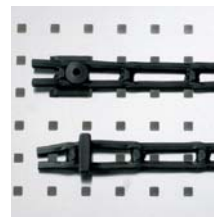
Leitergummi 30 mm breit, mit 2 Einhängeknöpfen, 1 m Art. Nr. 100985