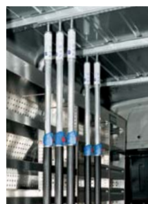
Teleskop-Sperrstange Aluminium Länge 1250-1750 mm Art. Nr. 103512 Länge 1550-2050 mm Art. Nr. 103153