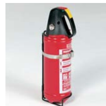
Feuerlöscher 2 kg inkl. Halterung ABC-Löschpulver Art. Nr. 100912

Weiteres Zubehör finden Sie in unserem Hauptkatalog oder unter www.aluca.de