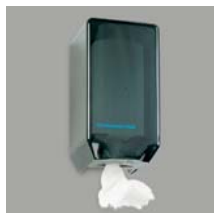
Handtuchhalter mit Papier-Einwegtüchern Art. Nr. 100938 9 Ersatzrollen Art. Nr. 100939