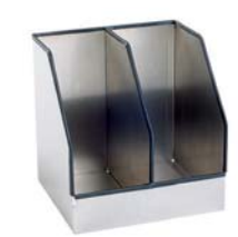
Ablagebox Aluminium, mit 2 Fächern Art. Nr. 100895