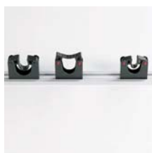
Gerätehalter Gerätehalter 20 - 30 mm Art. Nr. 101048 Gerätehalter 30 - 40 mm Art. Nr. 101049 Schiene 500 mm Art. Nr. 101050 Schiene 900 mm Art. Nr. 101051