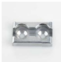
Zurrpunkt Aluminium, eloxiert Art. Nr. 106153