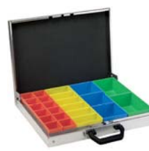
Aluminiumkoffer mit Insetboxen Abb. 1 Art. Nr. 100921 Abb. 2 Art. Nr. 100922 Abb. 3 Art. Nr. 100923