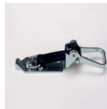
Spannverschluss aus verzinktem Stahl Länge Gummiband 90 mm Art. Nr. 100893