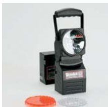
Akku-Handscheinwerfer Arbeits- u. Notstrom- leuchte, explosions- geschützt, inkl. Lade- station u. Halterung Art. Nr. 102950