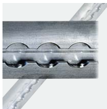
Zurrschiene Aluminium, 990 mm, Art. Nr. 100963 Aluminium, 1490 mm, Art. Nr. 100964