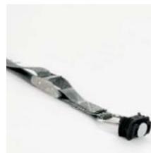
Spanngurt mit Klemmschloss, 1 m Art. Nr. 100982 mit Klemmschloss, 2 m Art. Nr. 100983