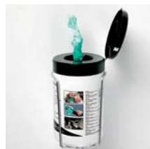
Feuchte Reinigungstücher Inhalt 50 Tücher Art. Nr. 100943 Wandhalterung Art. Nr. 100945