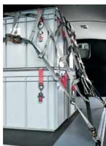
Ladungssicherungsnetz 1200 x 1800 mm mit umlaufendem Ratschenschloss- Ringgurt Art. Nr. 101014