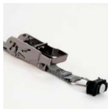
Zurrgurt mit Ratsche, 1 m Art. Nr. 100979 mit Ratsche, 2 m Art. Nr. 100980