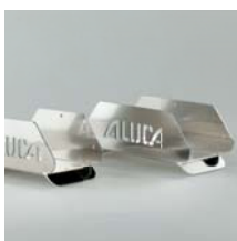
Schlauchhalter aus Aluminium Schlauchhalter SH25 Breite 250 mm Art. Nr. 105614 Schlauchhalter SH32 Breite 320 mm Art. Nr. 105616